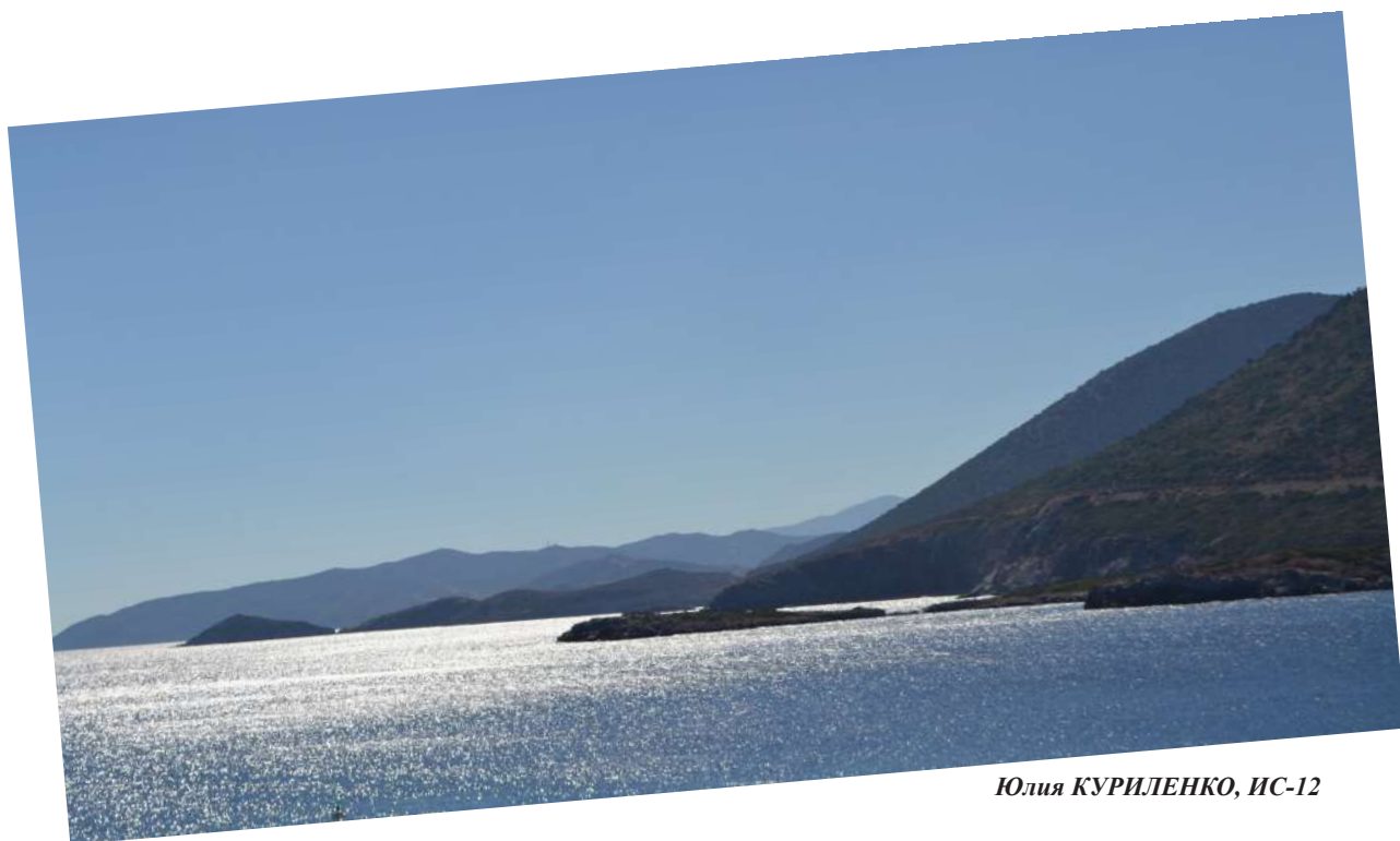
Юлия КУРИЛЕНКО, ИС-12