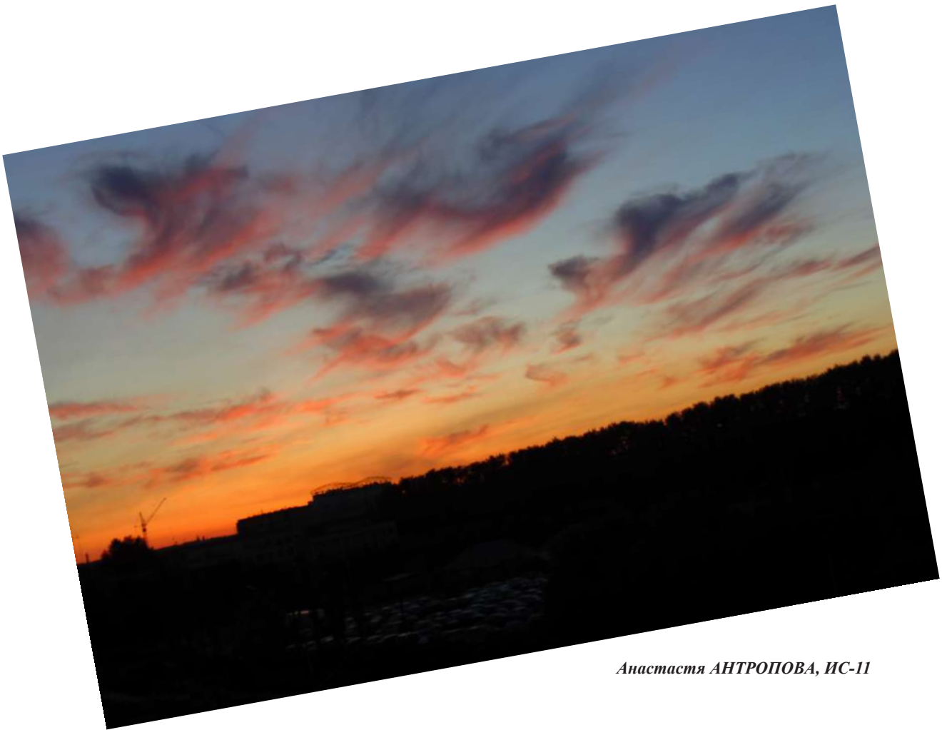
Анастасия АНТРОПОВА, ИС-11