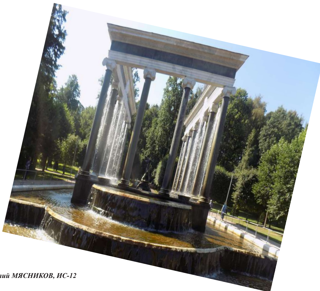
Виталий МЯСНИКОВ, ИС-12