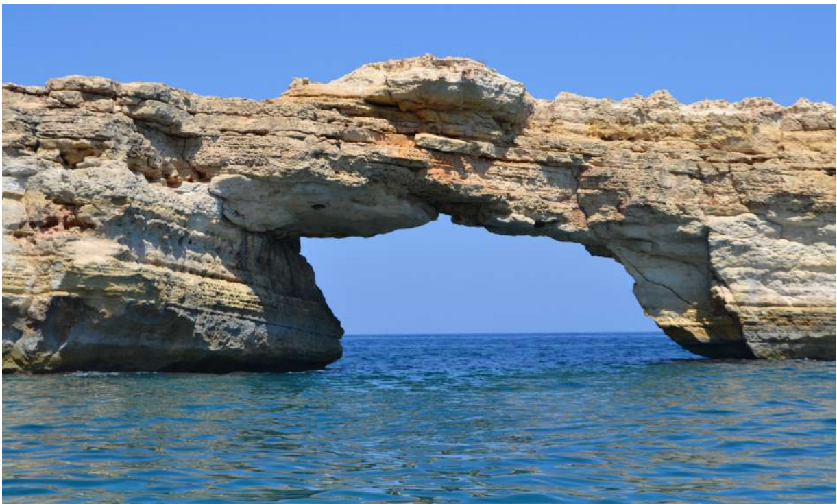
Юлия КУРИЛЕНКО, ИС-12