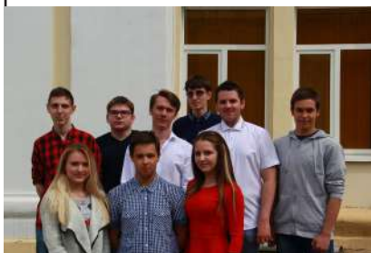
Редакции газеты «Мир КУПК»

-Гуляет щедро весь народ, Ведь скоро будет Новый год, А ты дерзай, учись, студент, Не прозевай уж свой момент!