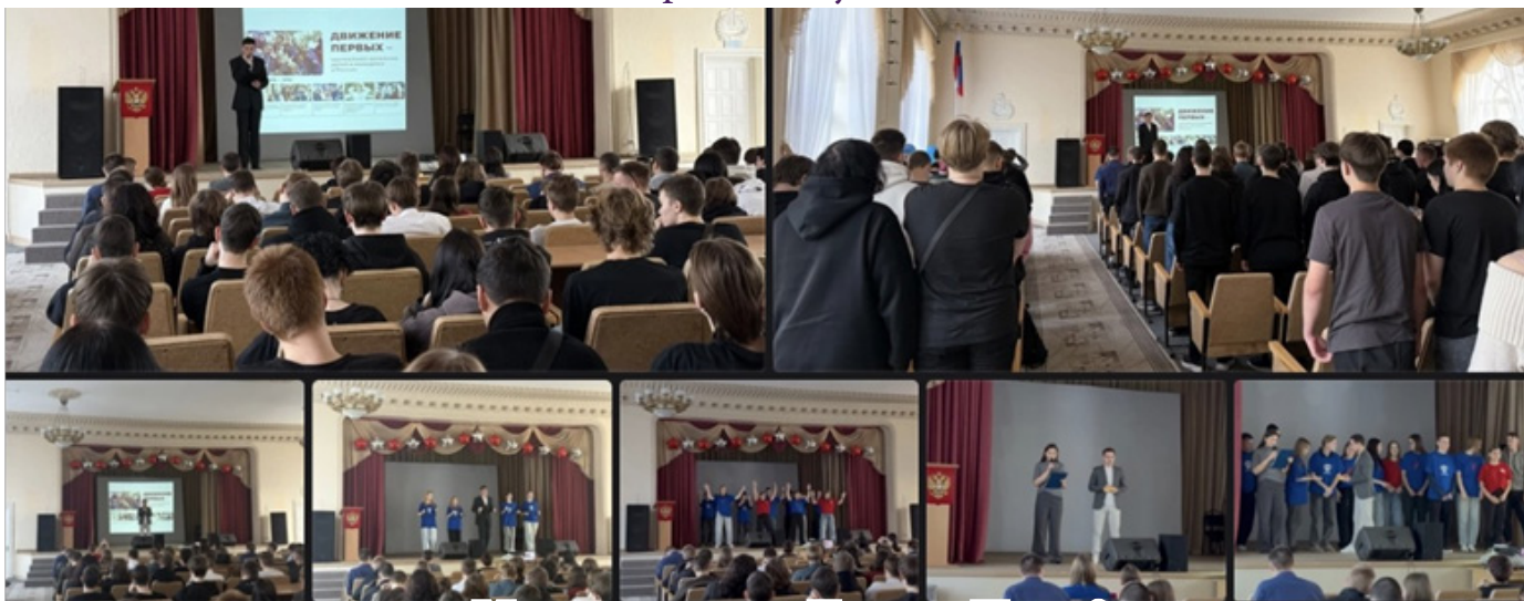
Музыкальное лото от Движения Первых!

Поздравляем всех награждаемых с таким важным событием и началом яркого и интересного пути!