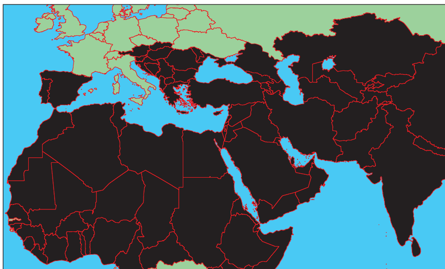
Карта мироустройства ИГИЛ

В настоящий момент группировка контролирует часть территории Сирии, а также ряд провинций в Ираке.