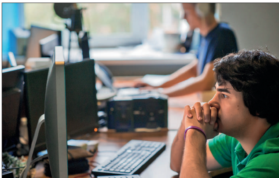
Постоянное присутствие вербовщиков ИГИЛ в соцсетях.

Активисты ИГИЛ поддерживают свои аккаунты в сетях Facebook, Twitter, Instagram, Friendica, Telegram. Активно они заявили о себе и в российских социальных сетях: «ВКонтакте» и «Одноклассниках».