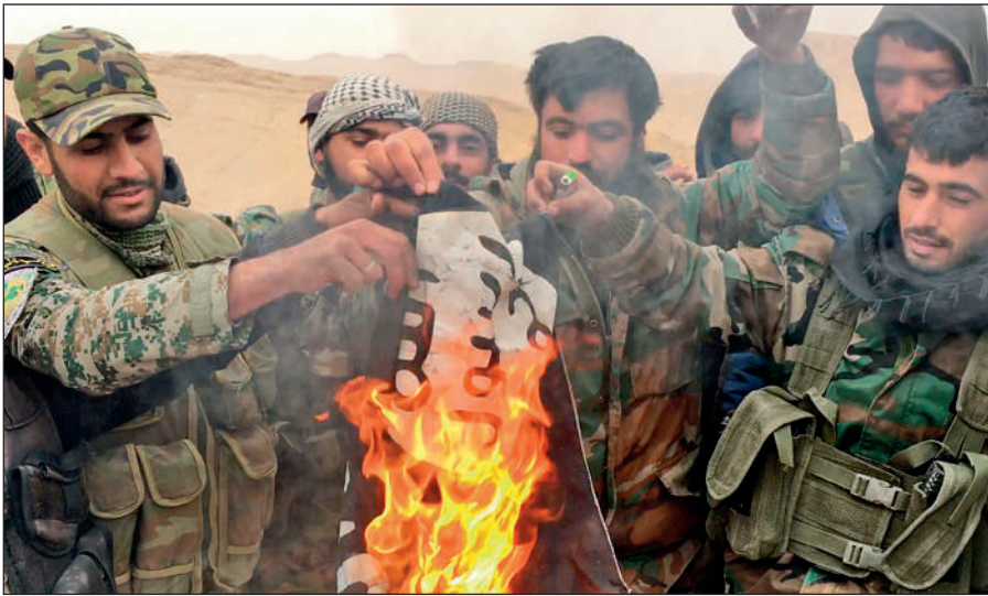
Народные ополченцы САР сжигают флаг ИГИЛ, снятый с отбитой у боевиков цитадели Пальмира.

Современное государство обязано защищать интересы каждого своего гражданина вне зависимости от его расы, национальности, принадлежности к определенной конфессии или религиозной традиции, в то время как ИГИЛ выражает интересы небольшой группы религиозных радикалов, жестоко подавляя остальную часть населения посредством запугивания, насилия и террора.