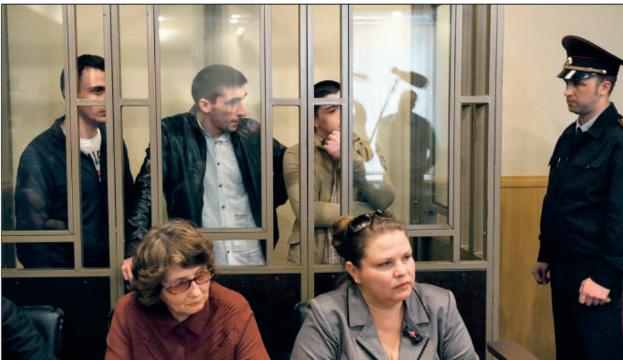
В Российской Федерации предусмотрена административная и уголовная ответственность за пропаганду идей терроризма, участие в деятельности террористических организаций.