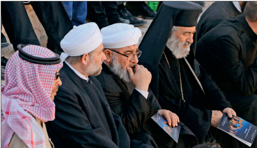
Представители различных конфессий объединились против ИГИЛ. На концерте симфонического оркестра петербургского Мариинского театра в Римском амфитеатре сирийской Пальмиры, освобожденной от террористов ИГИЛ.

В последнее время появилось значительное число верующих, причисляющих себя к крайним религиозным течениям (в СМИ упоминаются как «салафиты», «хариджиты», «ваххабиты»). Однако костяк ИГИЛ составляют лишь люди, причисляющие себя к ультрарадикальному крылу вышеназванных течений.