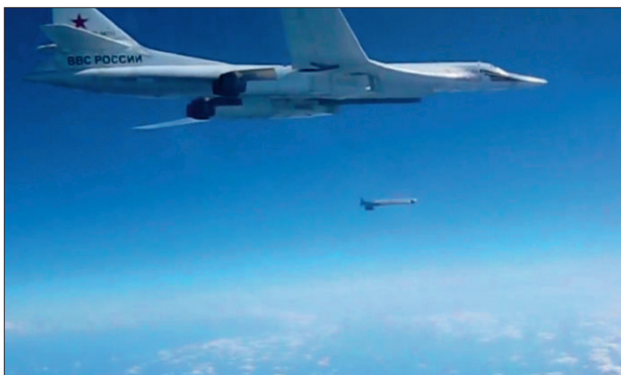
Воздушная операция российских ВКС по уничтожению боевиков ИГИЛ в Сирии.