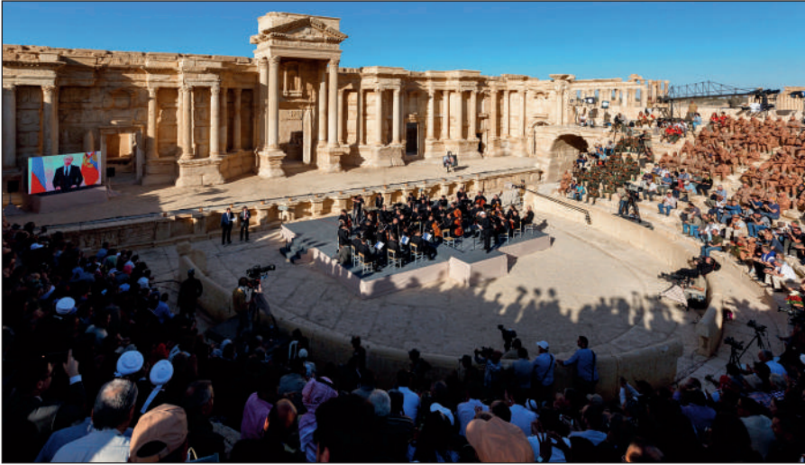
Освобожденная Пальмира. На концерте симфонического оркестра петербургского Мариинского театра под руководством народного артиста России Валерия Гергиева в Римском амфитеатре сирийской Пальмиры, освобожденной от террористов ИГИЛ.