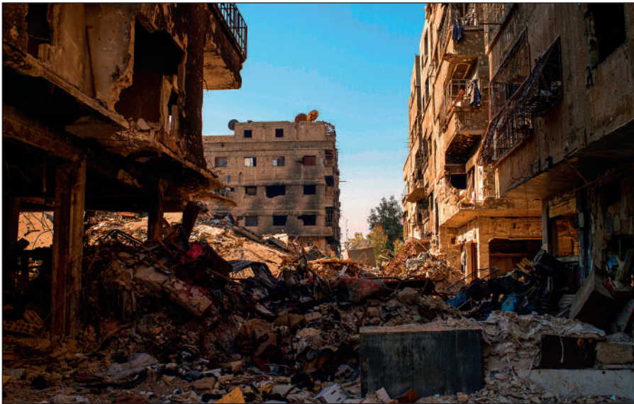
Разрушенный боевиками ИГИЛ Дамаск.

Террористы поставили на поток производство видеороликов с жестокими сценами казней пленников, заложников и «вероотступников». Эти материалы потом широко распространяются в социальных сетях и