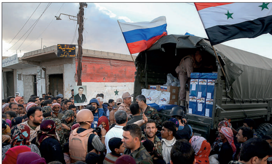
Россия оказывает гуманитарную помощь Сирии.