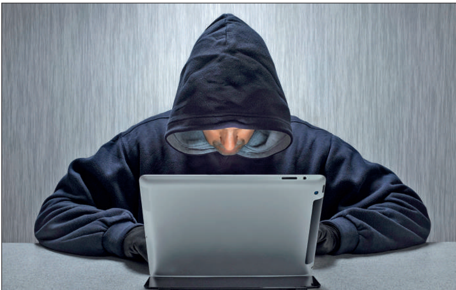
Вербовщики ИГИЛ активно используют Интернет.

Террористы день ото дня совершенствуют методы вербовки новых сторонников, а также алгоритмы их идеологической обработки. Читателю стоит помнить, что те типовые ситуации, которые описаны в данном пособии, можно рассматривать лишь в качестве базовых ориентиров,