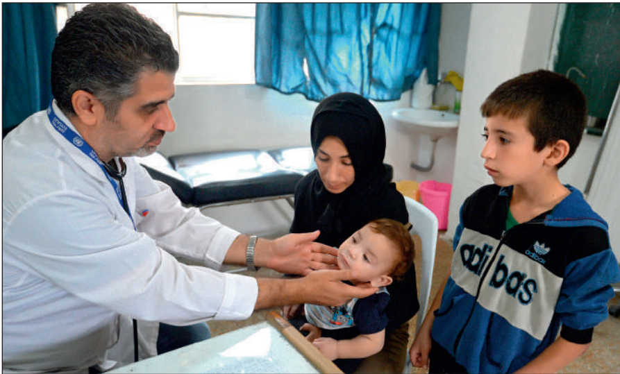
Истинный ислам призывает к состраданию и милосердию. Врач осматривает ребенка в медицинском пункте лагеря при одной из школ Дамаска.

Радикалы объявляют «врагами ислама» всех несогласных с ними мусульман. Ультрарадикальные группировки признают террор и насилие единственным способом достижения провозглашенных ими целей.